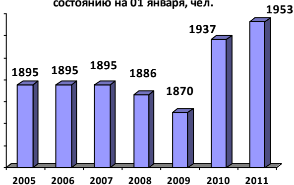
Динамика рождаемости, человек