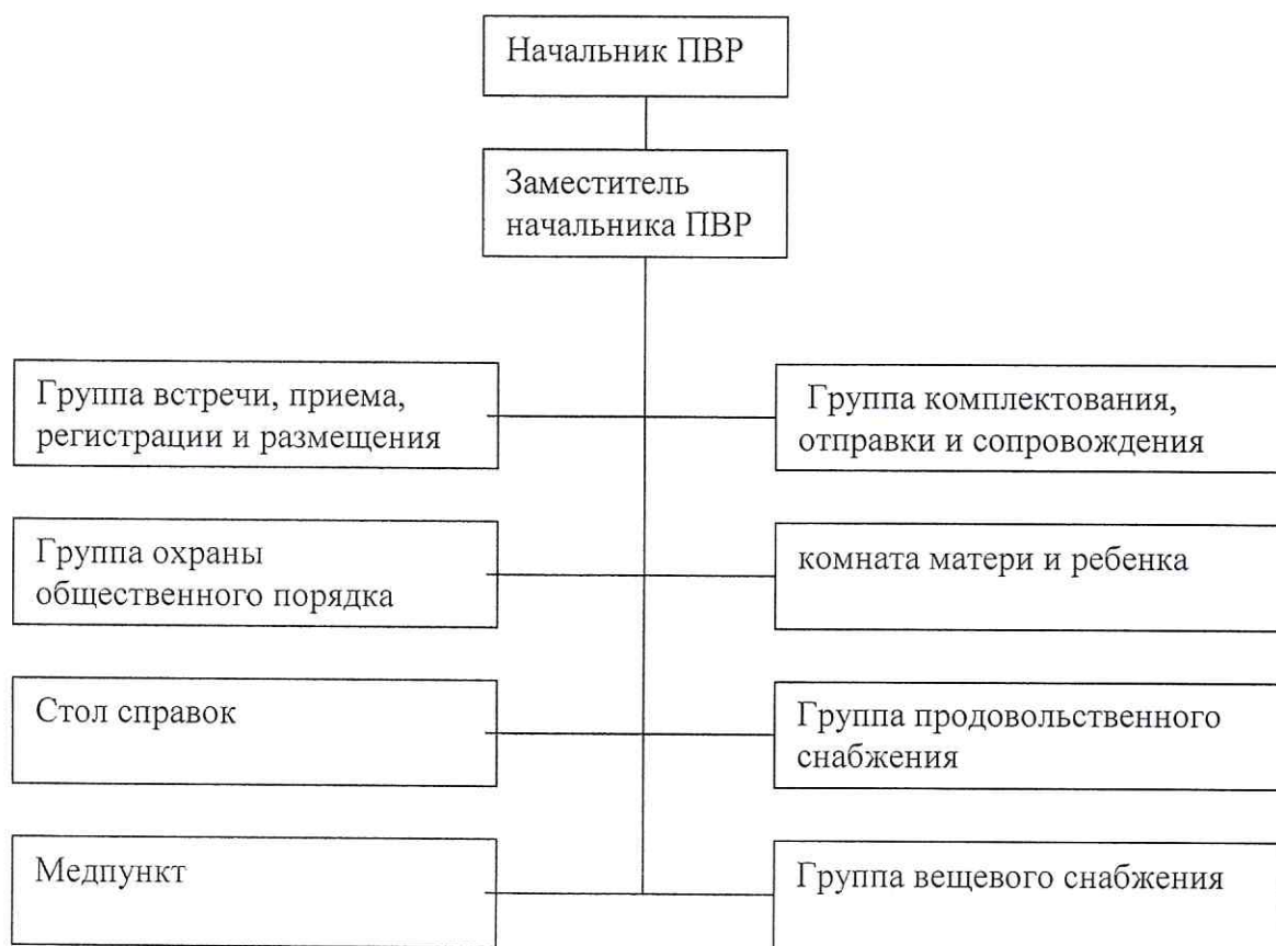
СХЕМА организации пункта временного размещения населения