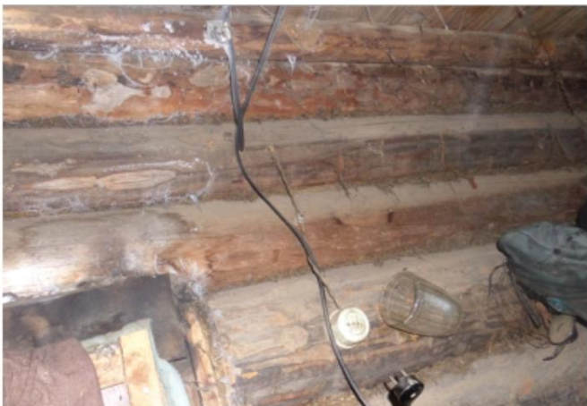
Фото № 3.1