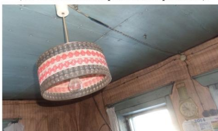
Фото № 1.2