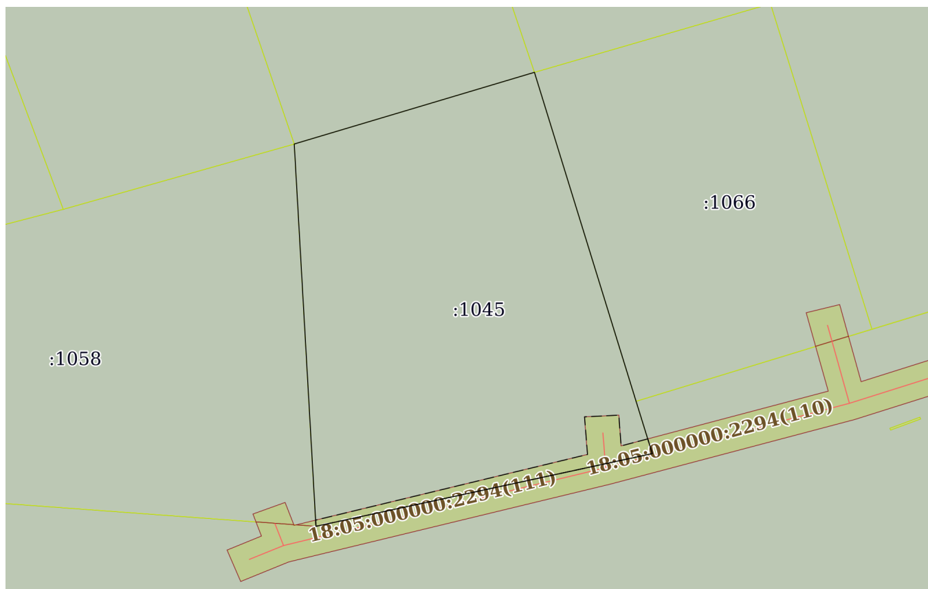
План (чертеж, схема) земельного участка